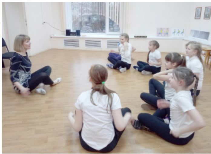
Урок исправления осанки